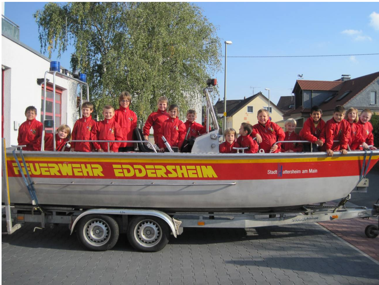
Die Eddersheimer Löschdrachen auf dem Eddersheimer Mehrzweckboot

Für unsere Löschdrachen konnten wir, mit Unterstützung des Steuerbüros Lutter, neue Wetterschutzjacken anschaffen. Somit können unsere Kleinsten nun auch bei durchwachsenem Wetter zu ihren Ausflügen oder Übungen gut geschützt ausschwärmen.