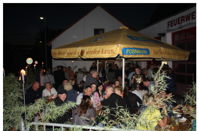
Gemütliche Lounge vor der Fahrzeughalle