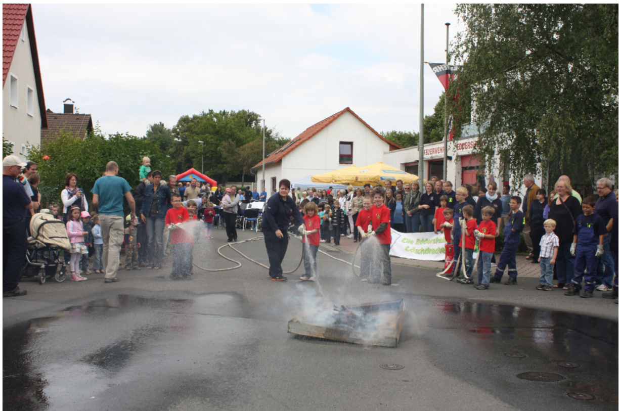
Schauübung der Eddersheimer Löschdrachen

Wie auch schon im Vorjahr nutzten wir den Tag der offenen Tür um den Übertritt der Kinder aus der Minifeuerwehr in die Jugendabteilung zu feiern. Insgesamt konnten drei Löschdrachen wechseln und bekamen offiziell ihre Jugendfeuerwehrausrüstung vom Jugendfeuerwehrwart überreicht. Anschließend löschten die Eddersheimer Löschdrachen einen brennenden Holzhaufen. Diese Schauübung kam bei den Besuchern und Eltern sehr gut an.