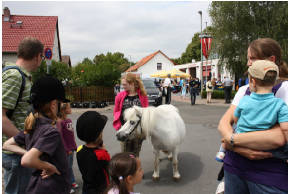
Pferde vom Wiesenhof

Für die jüngeren Besucher standen eine Hüpfburg, ein Spiele-Parcours der Jugendfeuerwehr sowie das Angebot der RSG-Wiesenhof „Pferde zum Anfassen“ zur Verfügung.