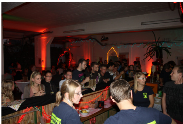
Cocktailbar in der Fahrzeughalle

Bei unserem mittlerweile 8. Cocktailabend im Feuerwehrhaus erlebten wir schon kurz nach Eröffnung der Veranstaltung eine positive Überraschung. Die Fahrzeughalle füllte sich sehr schnell mit Besuchern, so dass schon gegen 21 Uhr keine Plätze mehr frei waren. Ruck zuck wurden auf dem Vorplatz, der wieder zu einer gemütlichen Lounge umgestaltet war, weitere Bierzeltgarnituren aufgestellt um dem Besucherandrang gerecht zu werden. Der Umsatz konnte im Vergleich zum Vorjahr um etwa 30 % gesteigert werden und auch der Gewinn erfreute unseren Kassierer. Wir sind sehr froh, dass dieses Event mittlerweile einen breiten Besucherkreis anlockt und wir eine attraktive Veranstaltung anbieten können.