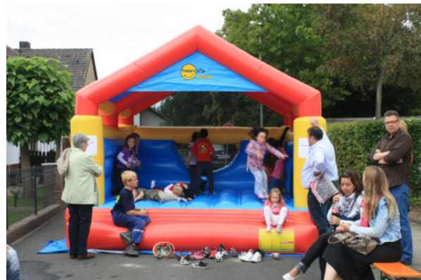
Kinder auf der Hüpfburg

Die Jugendfeuerwehr Eddersheim präsentierte eine besondere Schauübung. Die Jugendlichen mussten eine Person aus einem Kanalschacht retten. Hierbei war der richtige Umgang mit der Steckleiter gefragt und die Feuerwehrknoten mussten sitzen. Die Ausbilder waren rundum zufrieden und die Besucher erfreuten sich an einer spannenden technischen Übung, bei der sich mal nichts ums Feuerlöschen drehte.