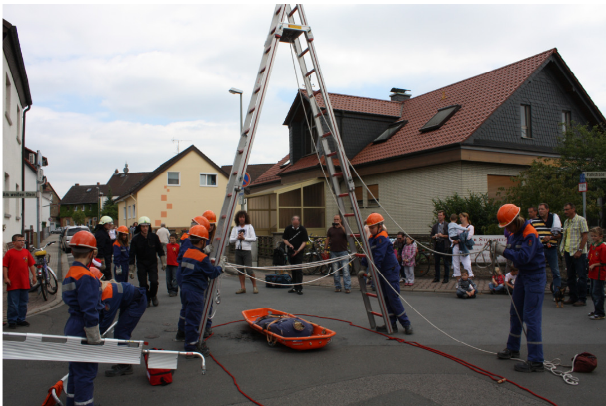
Schauübung der Eddersheimer Jugendfeuerwehr

Die Jugendfeuerwehr Eddersheim präsentierte eine besondere Schauübung. Die Jugendlichen mussten eine Person aus einem Kanalschacht retten. Hierbei war der richtige Umgang mit der Steckleiter gefragt und die Feuerwehrknoten mussten sitzen. Die Ausbilder waren rundum zufrieden und die Besucher erfreuten sich an einer spannenden technischen Übung, bei der sich mal nichts ums Feuerlöschen drehte.