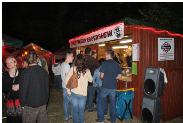
Impressionen Fischerfest 2012