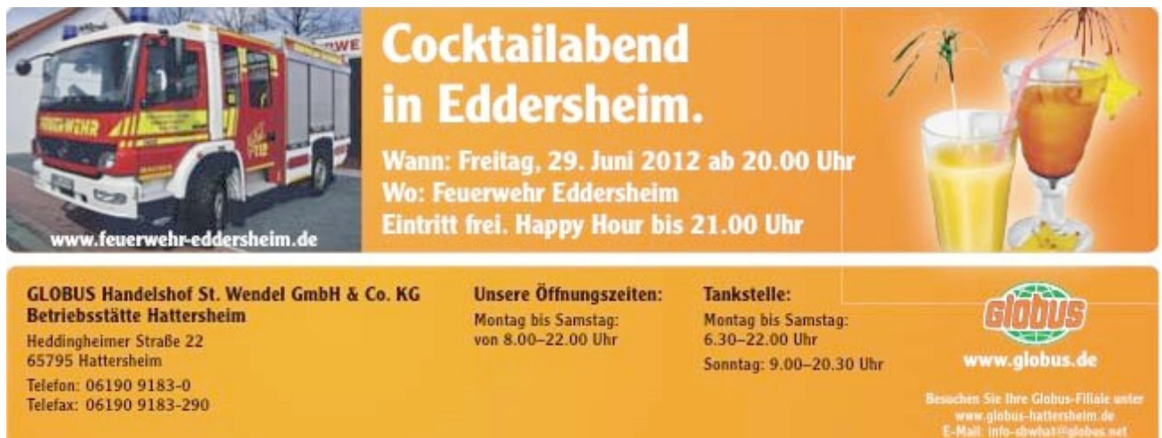
Anzeige im Globuswerbefaltblatt

Für unsere Veranstaltungen konnten wir die Firma Globus aus Hattersheim als Sponsor gewinnen. Durch Warenspenden und Werbung im Globuswerbefaltblatt unterstützte Globus uns bei unseren Veranstaltungen wie dem Cocktailabend oder dem Fischerfest. Diese neue Partnerschaft hat sich mittlerweile sehr positiv für die Feuerwehr Eddersheim entwickelt. Das Verhältnis ist sehr freundschaftlich und Globus hat immer ein offenes Ohr für die Belange der Feuerwehr. Durch das Sponsoring verringert sich unser finanzielles Risiko bei Veranstaltungen, deren Erfolg auch von der Wetterlage abhängig ist.