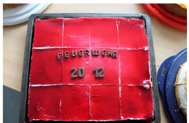
Kuchenauswahl & „Feuerwehrtkuchen“