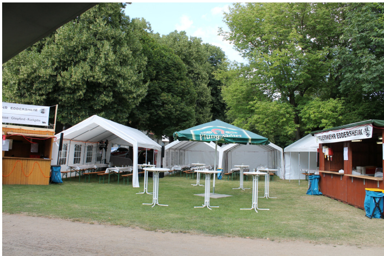
Vereinsstand Fischerfest nach dem Aufbau