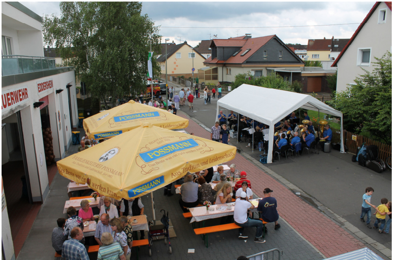
Tag der offenen Tür

Der traditionelle Tag der offenen Tür stand dann am Sonntag nach unserem Cocktailabend auf dem Programm. Hier wurde wieder der bewährte Mix aus einem bunten Familienprogramm mit moderaten Preisen für Essen und Getränke gewählt. Während die Kinder und Jugendlichen sich mit Spielen der Jugendfeuerwehr, auf der Hüpfburg oder beim Kinderschminken vergnügen konnten, hatten die Erwachsenen Zeit, sich über Rauchmelder oder den Umgang mit Feuerlöschern zu informieren.