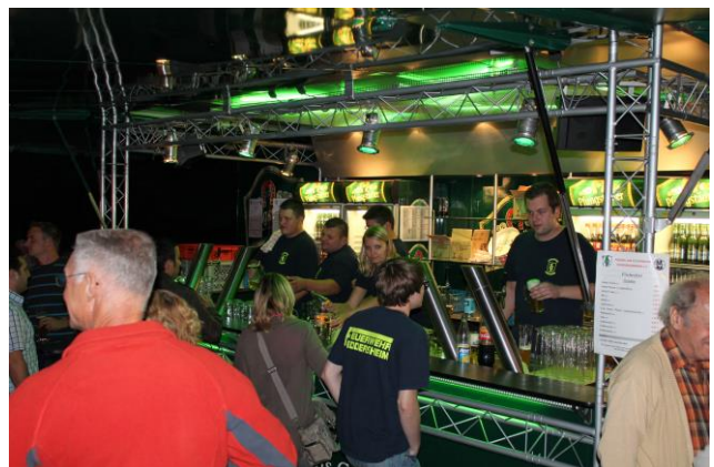
Impressionen des Fischerfests 2013