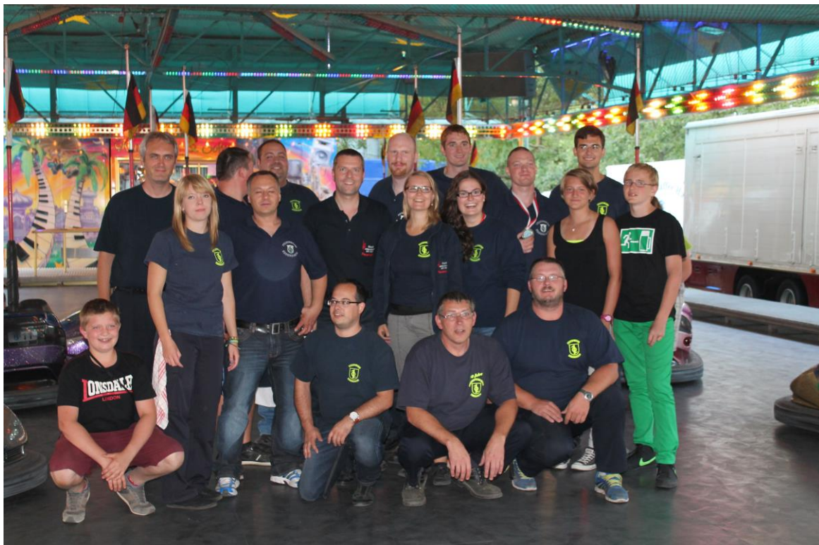
Gemeinsame Abschlussfahrt am Autoscooter

In meinem Jahresbericht 2012 hatte ich die neue Bestmarke seit der Teilnahme am Fischerfest verkündet. Ein Jahr später nun berichte ich von einer weiteren Steigerung. Ich hoffe, dass sich der Trend so weiterentwickelt, bin aber trotzdem Realist und weiß, dass es wetterbedingt auch mal wieder schlechtere Feste geben kann. Jedoch sind das äußere Einflüsse, die wir nicht beeinflussen können. Und dort, wo unser Einfluss möglich ist, werden wir wieder unser Bestes geben, um gemeinsam am Erfolg zu arbeiten. Dafür ist die Wehr Eddersheim bekannt und das zeichnet unsere Mannschaft aus.