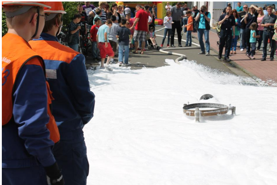
Schaumteppich der Jugendfeuerwehr

Der Nachwuchs der Feuerwehr Eddersheim konnte sein Erlerntes bei Schauübungen unter Beweis stellen. Die Löschdrachen löschten ein Feuer mit Bravour während unsere Jugendfeuerwehr den Kreuzungsbereich vor dem Feuerwehrhaus in eine Schaumlandschaft verwandelte. Der üppige Schaumeinsatz war ganz nach dem Geschmack unserer jüngsten Besucher, die sich direkt auf die weiße Pracht stürzten.