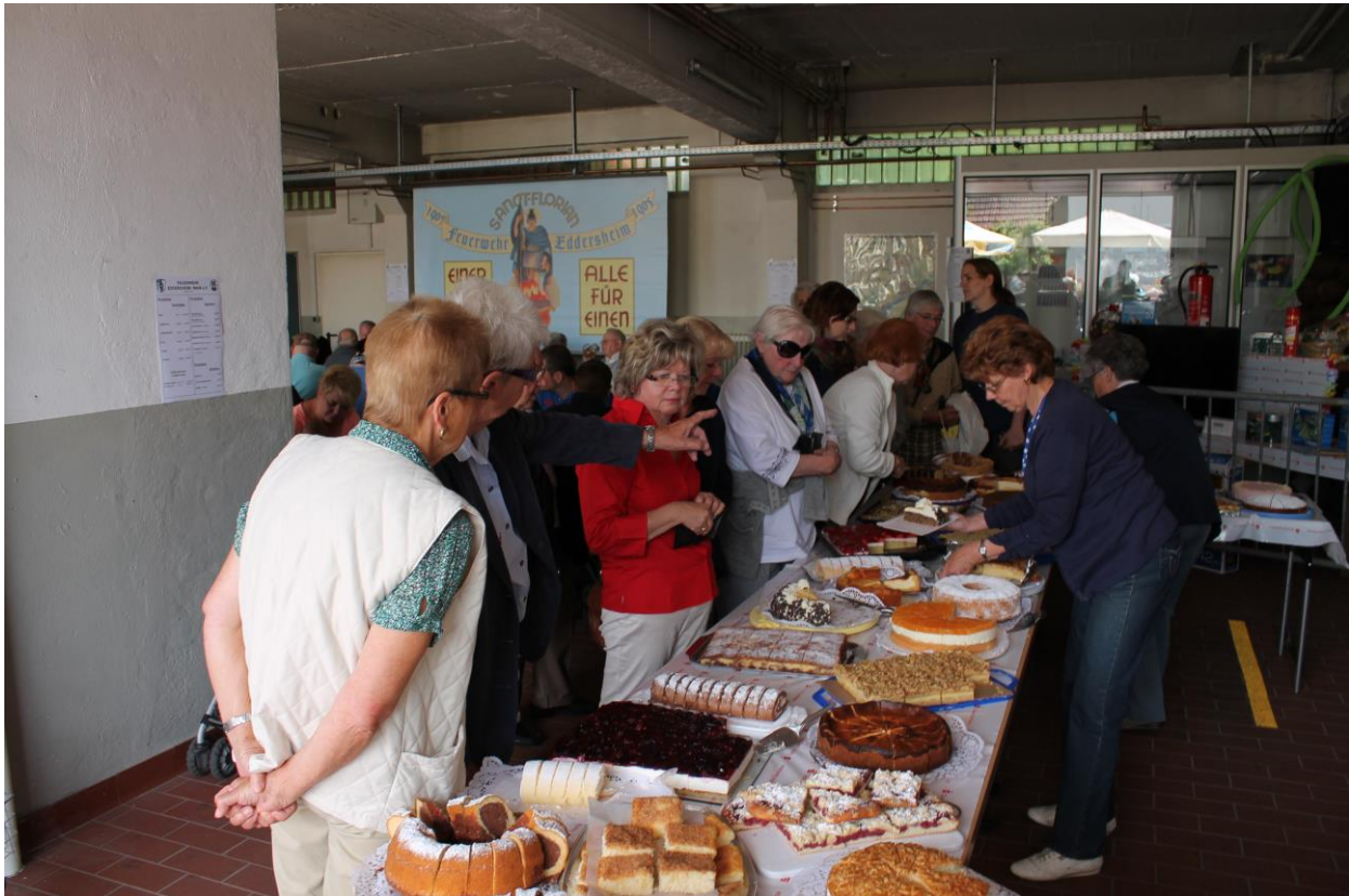
Ansturm auf die Kuchenausgabe

Gleichermaßen geht der Dank auch an die zahlreichen Kuchen-spende, die uns jedes Jahr mit wunderbaren selbstgebackenen Kuchen versorgen. Die Eröffnung der Kuchentheke wird jedes Jahr von unseren Besuchern mit Spannung erwartet und der Ansturm auf die vielen leckeren und kreativ dekorierten Kuchen und Torten ist entsprechend groß.