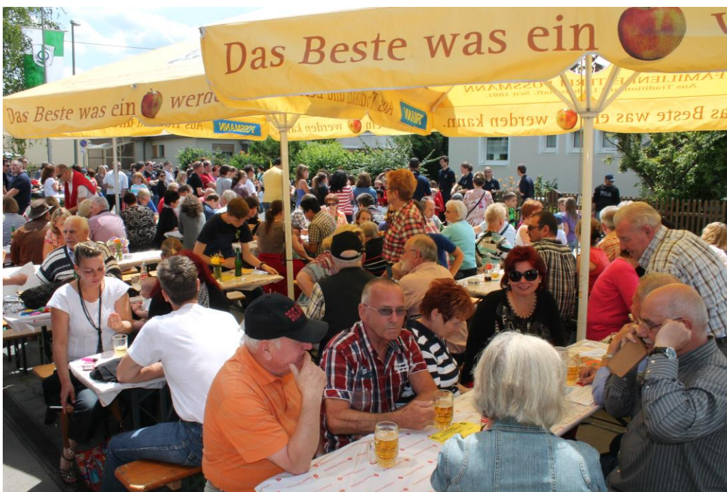
Tag der offenen Tür