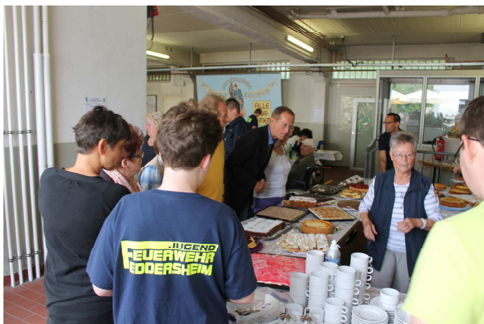
Große Auswahl an leckeren Kuchen

Gleichermaßen geht der Dank auch an die zahlreichen Kuchen-sponder, die uns jedes Jahr mit wunderbaren selbstgebackenen Kuchen versorgen.