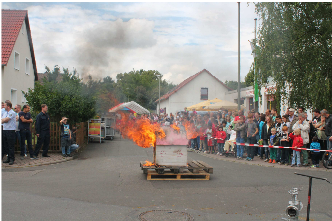
Brennendes Holzhaus für die gemeinsame Übung der Mini- und Jugendfeuerwehr