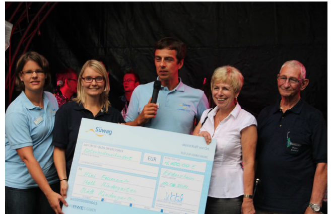
Impressionen des Fischerfests 2014