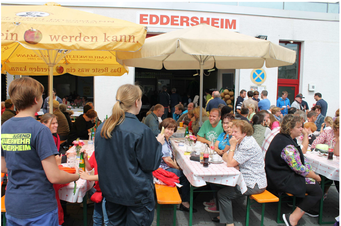
Tag der offenen Tür